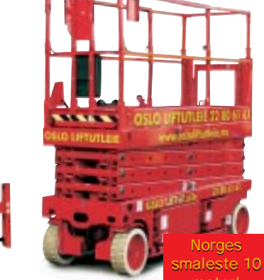
Type: Genie 2632 Arbeidshøyde: 10 meter Plattformlast: 230kg. Drift: Batteri. Minste bredde: 81,3cm