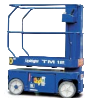
Type: UpRight TM12 Arbeidshøyde: 6 meter Plattformlast: 230kg. Drift: Batteri. Minste bredde: 76cm