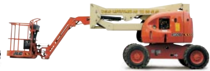
Type: JLG 450AJ 4WD Drift: Diesel. Arbeidshøyde: 16 meter. Kurvlast: 230 kg. Minste bredde: 198 cm. Transporthøyde: 224 cm