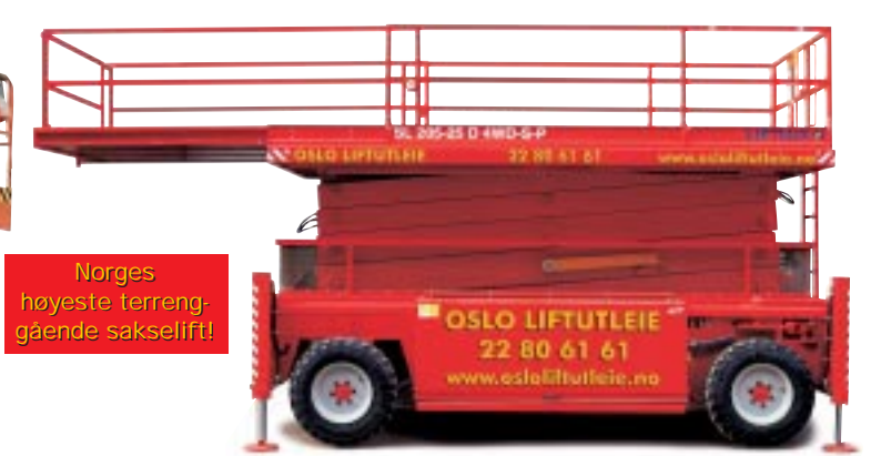
Type: Liftlux SL 205-25/4WD SP Arbeidsh.: 22,5 m - Plattforml.: 7,2m - Plattformlast: 1000 kg. Drift: Diesel. Minste bredde: 255cm

Norges høyeste terreng-gående sakselift!