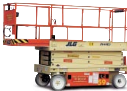
Type: JLG 2646 E3 Arbeidshøyde: 10 meter Plattformlast: 350 kg. Drift: Batteri. Minste bredde fra 117 cm