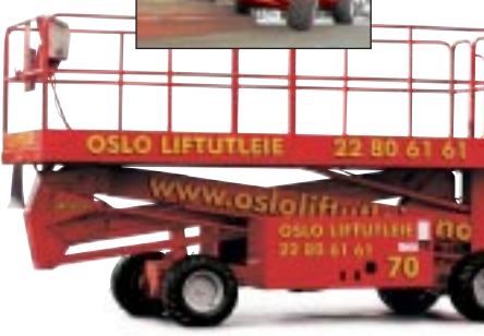
Type: UpRight SL30SL 4WD Arbeidshøyde: 11 meter Plattformlast: 590 kg. Drift: Diesel. Minste bredde:213cm