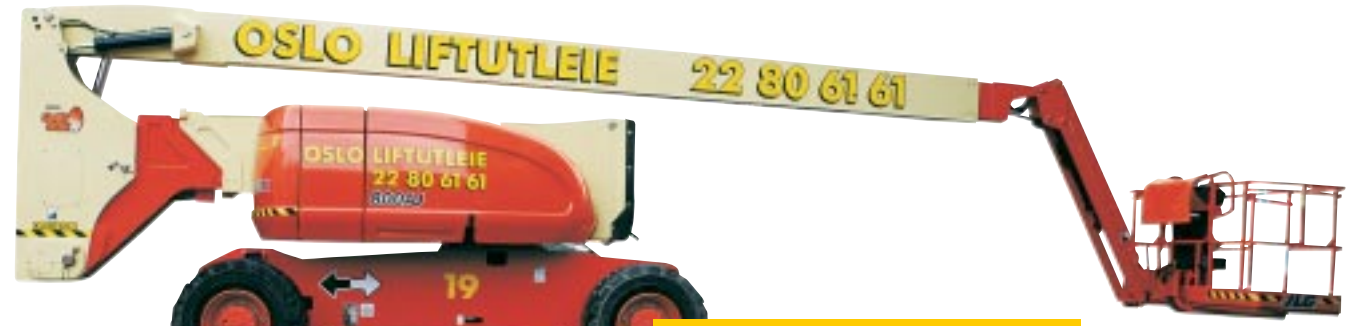
Type: JLG 800 AJ 4WD Arbeidshøyde: 26 meter. Kurvlast: 230kg. Drift: Diesel. Minste bredde: 244cm. Transporthøyde: 300cm. Overheng: 76cm

40 meter Norges eneste og nest høyeste superboom!