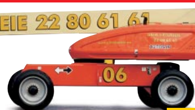
Type: Genie S125 4WD Arbeidshøyde: 40 meter. Kurvlast: 230 kg. Drift: Diesel. Minste bredde: 260/350cm. Transporthøyde: 307 cm

43 meter Norges eneste og høyeste ultraboom!