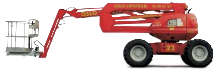
Type: Manitou 165 ATJ 4WD Drift: Diesel. Arbeidshøyde: 16,5 meter. Kurvlast: 250 kg. Minste bredde: 236 cm. Transporthøyde: 238 cm