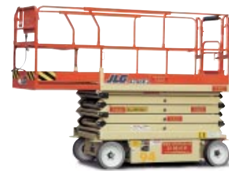
Type: JLG 3246 Arbeidshøyde: 12 meter Plattformlast: 317 kg. Drift: Batteri. Minste bredde:117cm