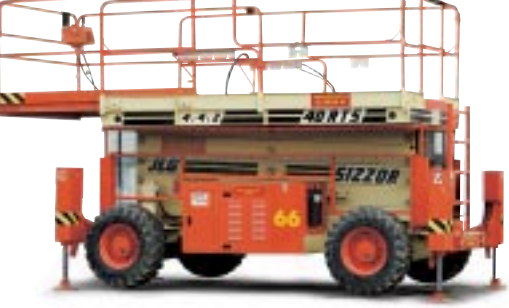
Type: JLG 40 RTS 4WD Arbeidsh.: 14 m. Plattformlast: Fra 340 - 680 kg. Drift: Diesel. Minste bredde:229cm