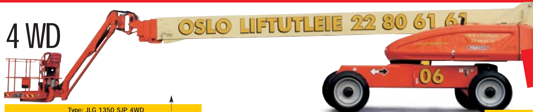
Type: JLG 1350 SJP 4WD Arbeidshøyde: 43 meter. Kurvlast: 230-450 kg. Drift: Diesel. Minste bredde: 249/380cm. Transporthøyde: 305cm

43 meter Norges eneste og høyeste ultraboom!