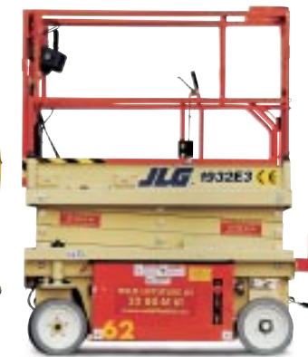
Type: JLG 1932 E3 Arbeidshøyde: 8 meter Plattformlast: 230kg. Drift: Batteri. Minste bredde: 75cm