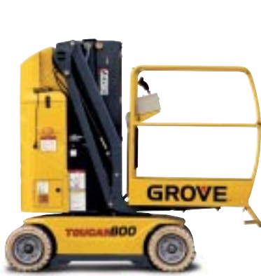
Type: Toucan 800 Arbeidshøyde: 8 meter Plattformlast: 200kg. Drift: Batteri. Minste bredde: 99cm