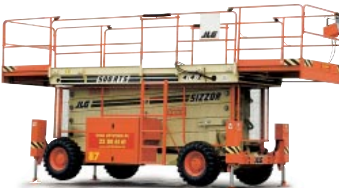
Type: JLG 500 RTS 4WD Arbeidsh.: 17 m. Plattforml.: 6,73m - Plattformlast: Fra 454 - 907 kg. Drift: Diesel. Minste bredde:229cm