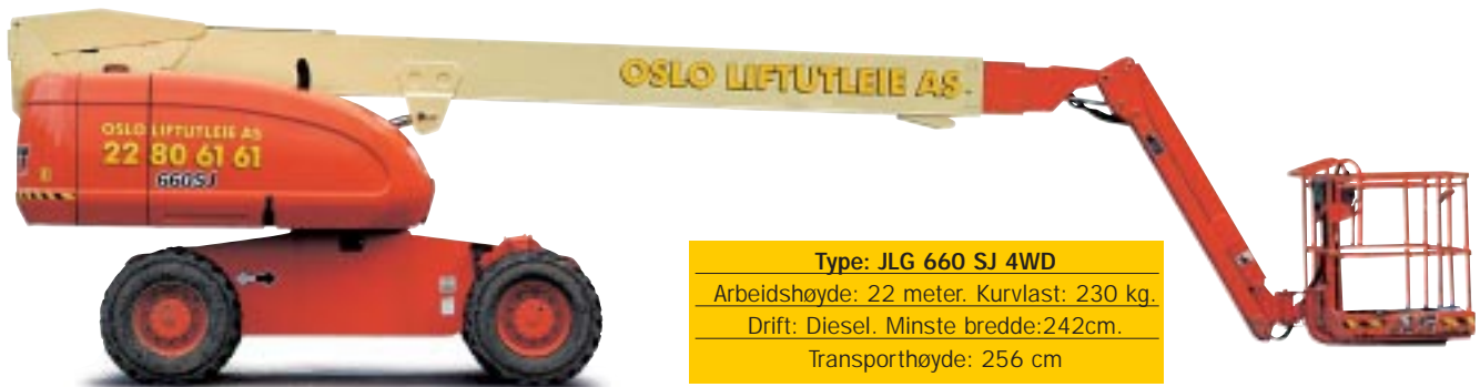
Type: JLG 660 SJ 4WD Arbeidshøyde: 22 meter. Kurvlast: 230 kg. Drift: Diesel. Minste bredde: 242cm. Transporthøyde: 256 cm