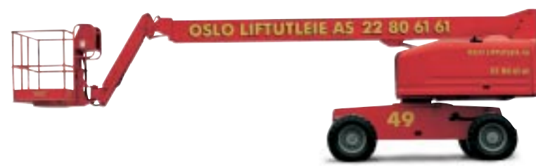
Type: Genie S45 4WD Drift: Diesel. Arbeidshøyde: 16 meter. Kurvlast: 230 kg. Minste bredde: 230 cm. Transporthøyde: 250 cm