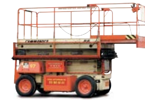
Type: JLG 3969 Arbeidshøyde:14 meter Plattformlast: 340 kg. Drift: Batteri. Minste bredde:180cm