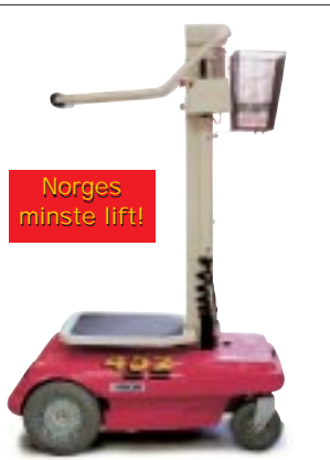
Type: Aichi SX-015 Arbeidshøyde: 3,5 meter Plattformlast: 120kg. Drift: Batteri. Minste bredde: 68cm