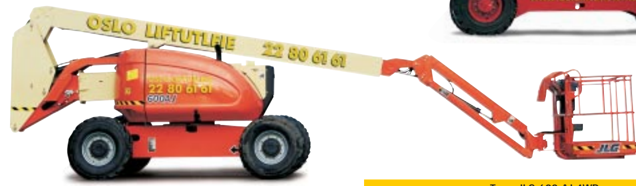
Type: JLG 600 AJ 4WD Arbeidshøyde: 20 meter. Kurvlast: 230 kg. Drift: Diesel. Minste bredde: 244cm. Transporthøyde: 256cm